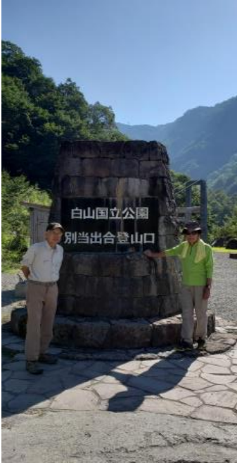
001（左） 別当出合登山口

8/19 白山室堂－御前峰－中宮道・大汝峰分岐－七倉の辻－油池－天池－百四丈滝展望台－奥長倉避難小屋－長倉山－しかりば分岐－ハライ谷登山口－一里野温泉（泊）