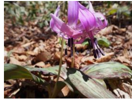
登山道の脇にはカタクリ