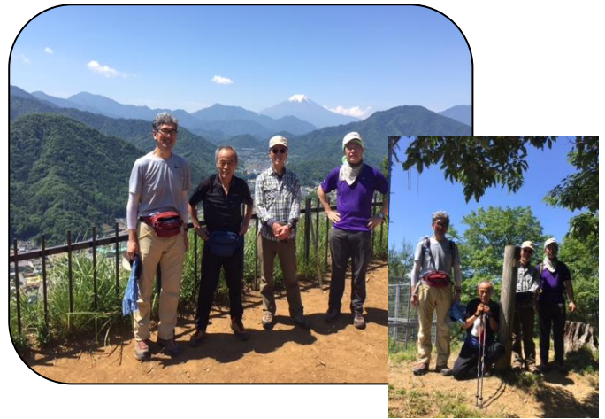
←003 左側が切れたトラバース

岩殿山頂上で記念写真。でも最高峰はそこから少し行った 烽火台(634m)です。その昔 のろしをあげた所だそうです。標高はスカイツリーと同じ 634m。