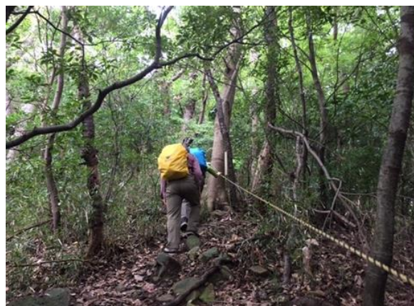
002 ロープが頼りの急登