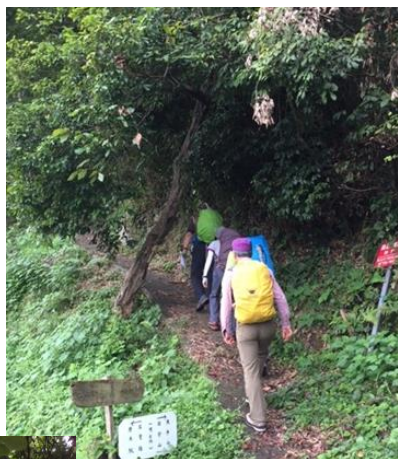
←001 奥沼津アルプスへの第一歩