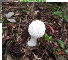
003 大嵐山 (日守山) →

茶臼山を経て着いた頂上は立派な三等三角点がある大嵐山(192.2m)。低山でも街並みがきれいに見渡せる。少し早目のランチタイムも気持ちいい！