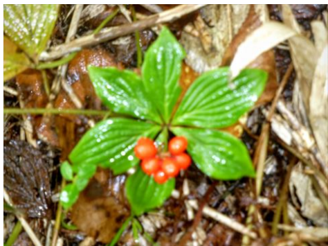
001 ゴゼンタチバナの実

木道脇には、実をつけたゴゼンタチバナやシラタマノキが。倶楽部徽章の花”ゴゼンタチバナ”に赤い実がつくの初めて知りました。