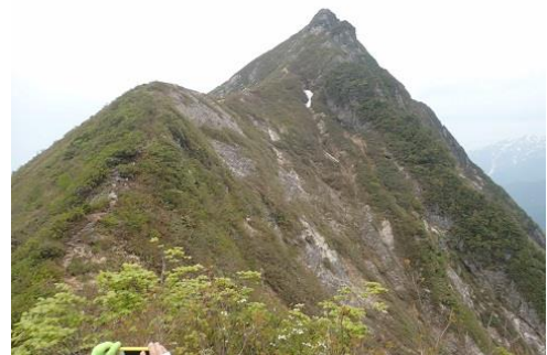
009 日本のマッターホルン。