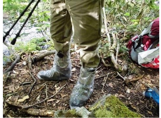
007 渡渉グッズ。これのおかげで助かりました。