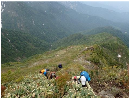
008 山頂まであとわずか。