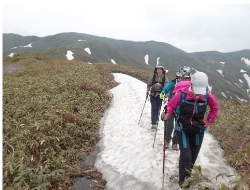
010 残雪の尾根を歩きます。